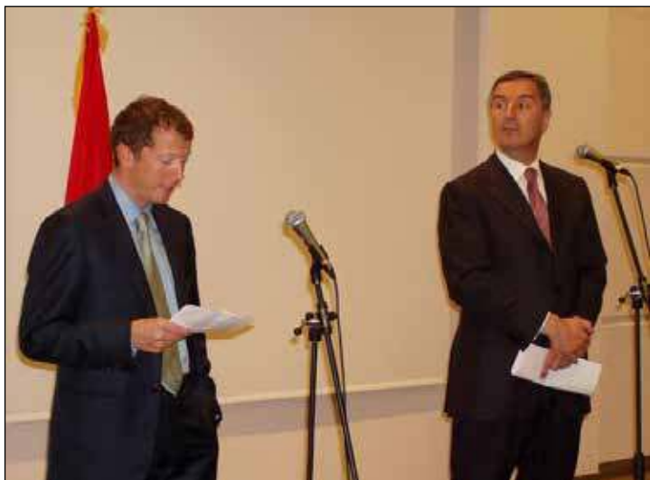
Нејтан Ротшилд, покровитељ Мила Ђукановића у име свог оца Јакоба

Хрвата и Албанаца или је нова верзија лажног цара који државу сигурно гура у пакао.