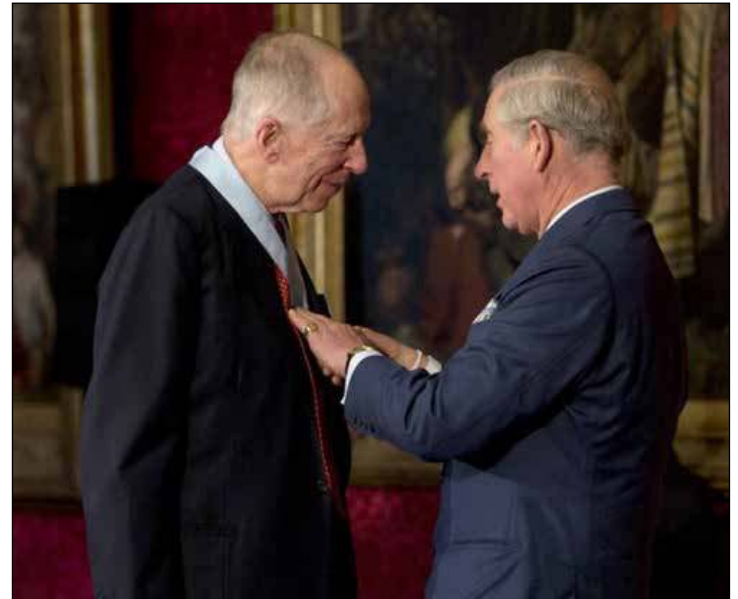
Јакоб Ротшилд и принц Чарлс

Важно је да запамтите да је главно оружје банкара новац, којим они поткупљују војну и безбедносну елиту неке земље, тако да она изда свог јаког лидера и свој народ. Сада вам је јасно зашто је Стаљин, с времена на време, ликвидирао камарилу око себе.